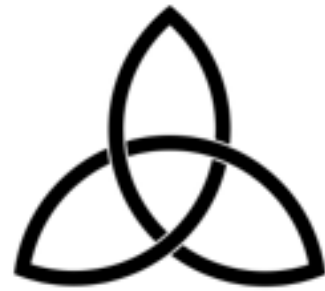
Triquetra, gammal symbol för treenigheten.

Eftersom ni är söner, har Gud sänt i våra hjärtan sin Sons Ande som ropar: Abba! Fader! (Gal. 4:6).